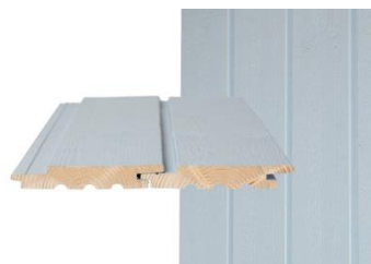
GOLD PRO-S Pystypanelointi