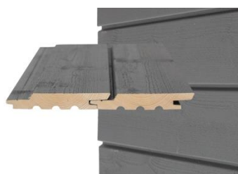
GOLD PRO-W Vaakapanelointi