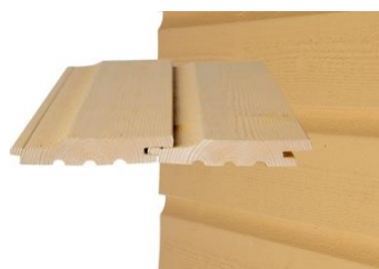
GOLD PRO-K Vaakapanelointi