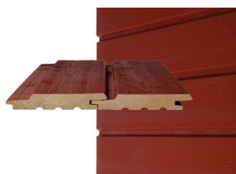
GOLD PRO-V Vaaka- ja pystypanelointi